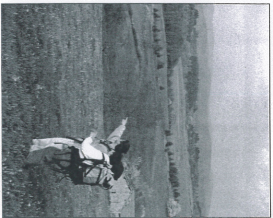
Panorama vers le village du Poux

Traverser le hameau puis, 30 m après, emprunter le chemin de gauche. A hauteur du plan d'eau, passer le pont