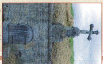
Capraige dans le bourg

2 A l'entrée du hameau de Cublas , à hauteur d'un hangar, prendre le chemin de terre à droite. A l'intersection suivante, tourner à gauche (point de vue sur la vallée de la Dore et le clocher de Tours sur Meymont). A la route, monter à gauche puis, dans le hameau tourner tout de suite à droite