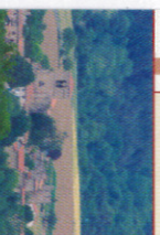
Le bourg de Sauviat